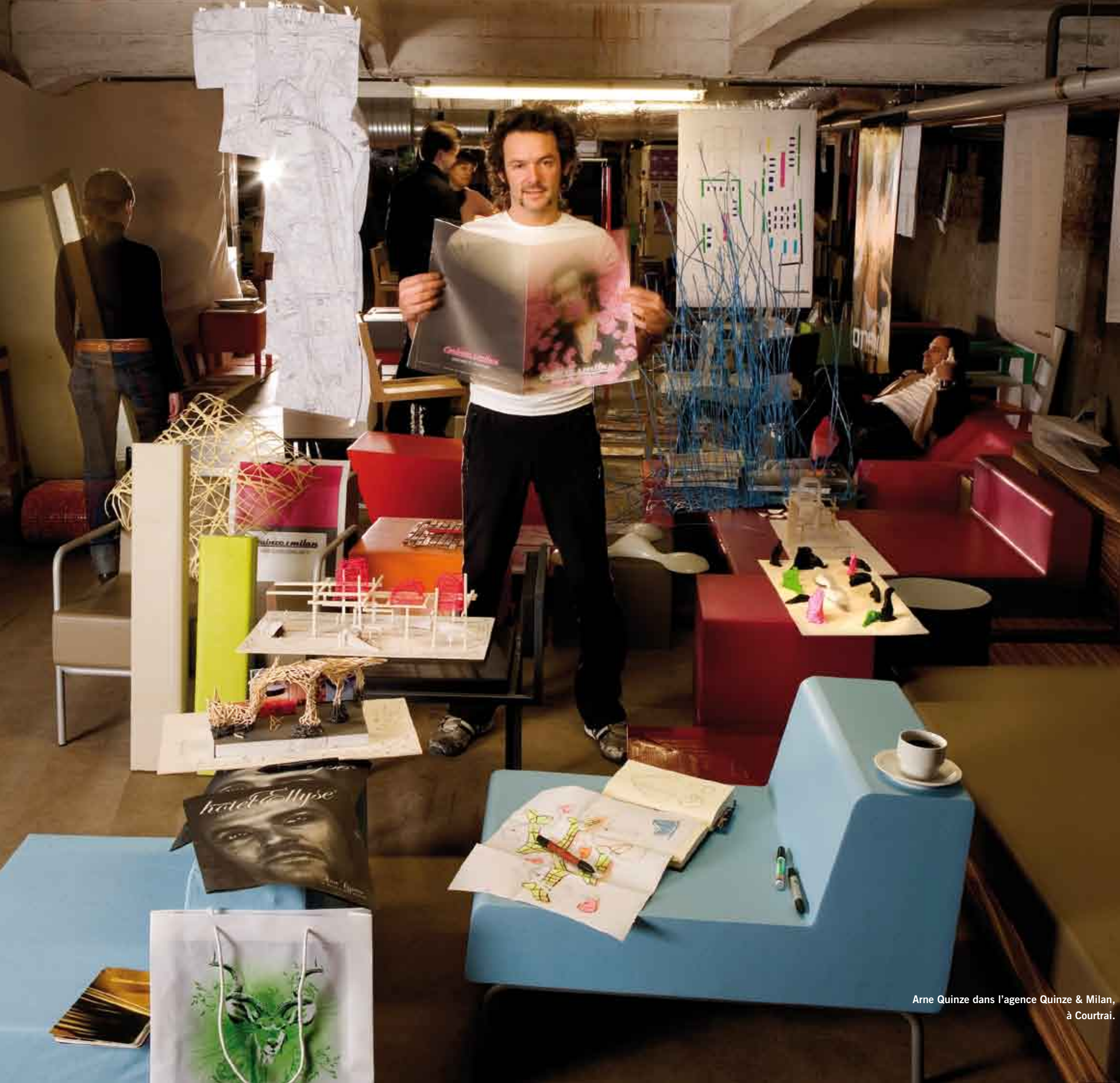
Arne Quinze dans l'agence Quinze & Milan, à Courtrai.